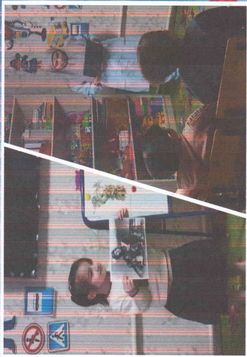
Беседа в средней группе «Сан Дада турналхо»