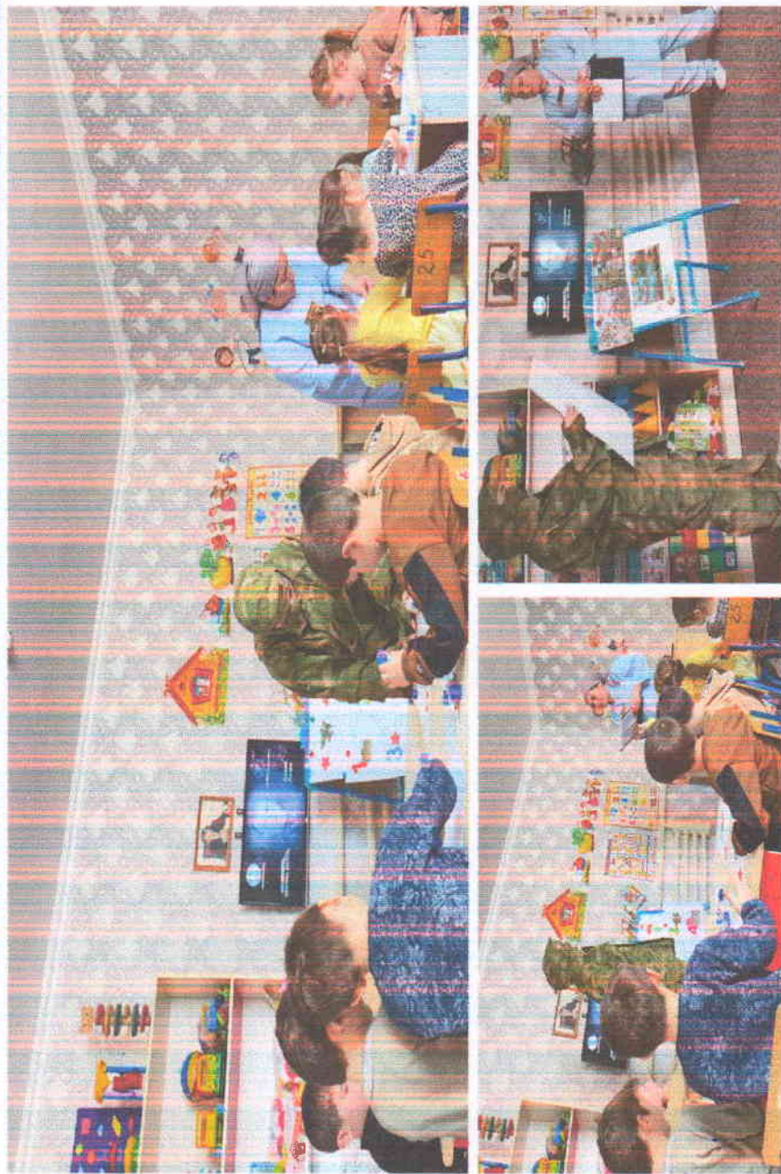
Заняття в старшій групі «Ромашка» Тема заняття «Турпалхо Даша Акаєв»